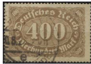
5187 Deutsches Reich