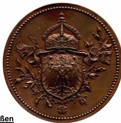
414 Brandenburg - Preußen