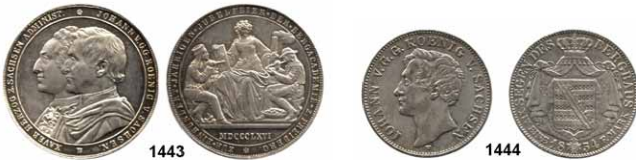
1443 Johann 1854 – 1873