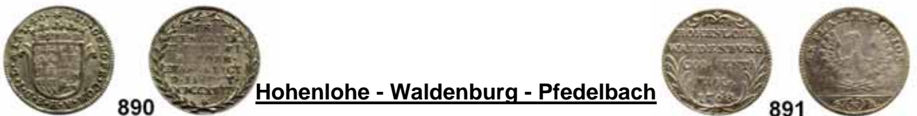
890 Hohenlohe - Waldenburg - Pfedelbach Ludwig Gottfried 1685 – 1728

889 LOT von 18 Kleinmünzen; 1602 bis 1763; 4x Bistum, 14x Stadt; 15x Ag., 3x Cu..... Meist sehr schön 60,-