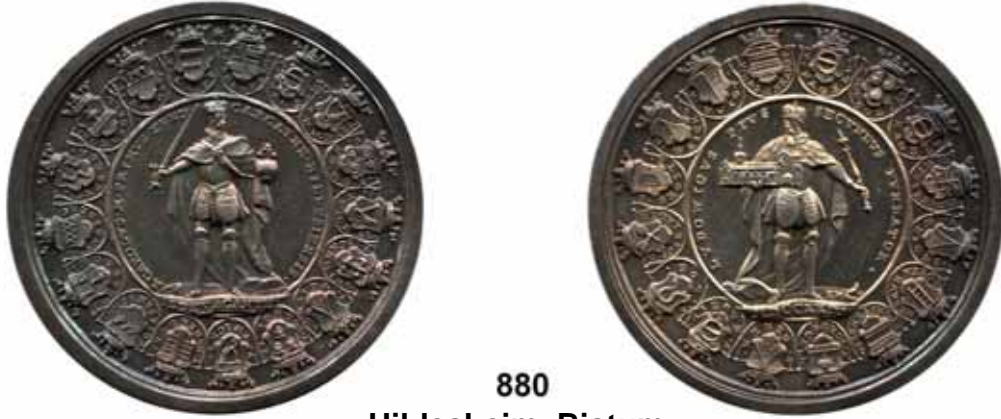
880 Hildesheim, Bistum