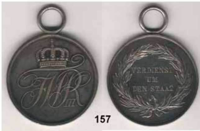
Wilhelm II. 1888 – 1918