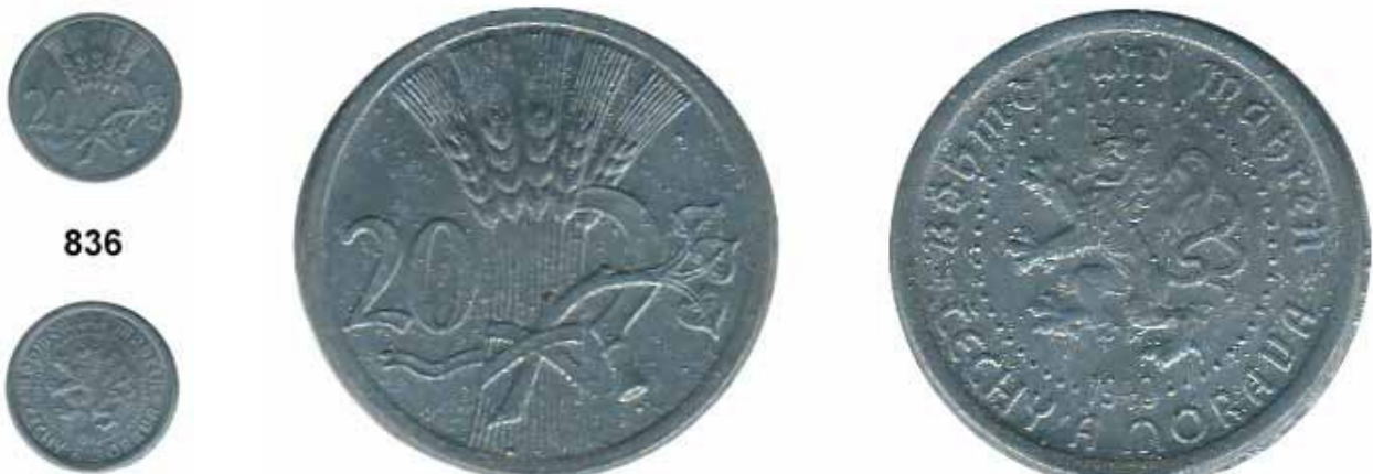
Losnummer 836 vergrößert