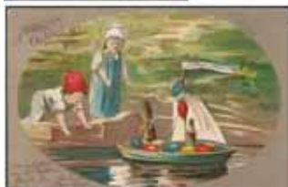
3226 25 farbige Weihnachts-/Neujahrskarten aus der Zeit bis 1912, davon 17 Prägekarten herrliche Motive..... 70,-