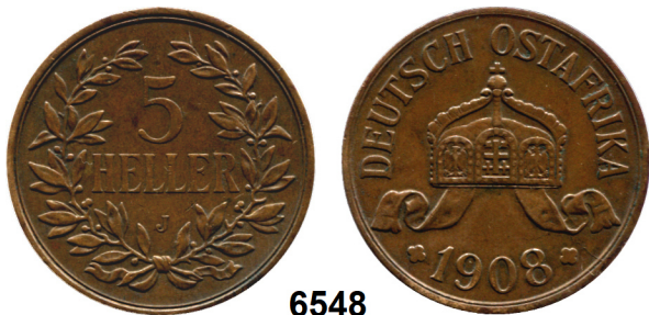
6548 Deutsch - Ostafrika