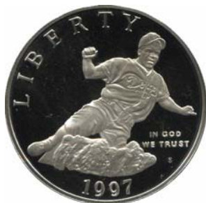
18903 U. S. A. 18904