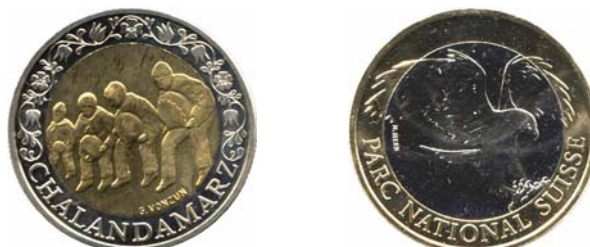
18594 Schweiz 18595