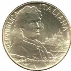
18215 Italien 18219