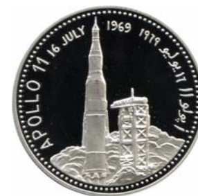
18249 Jemen 18250