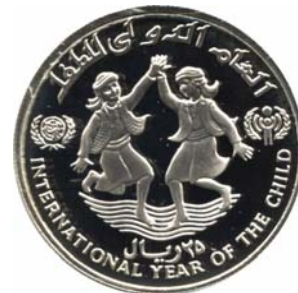
18240 Jamaika 18248