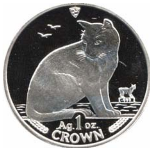
18125 Isle of Man 18126