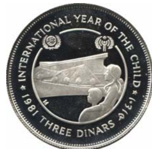
18261 Jordanien 18267