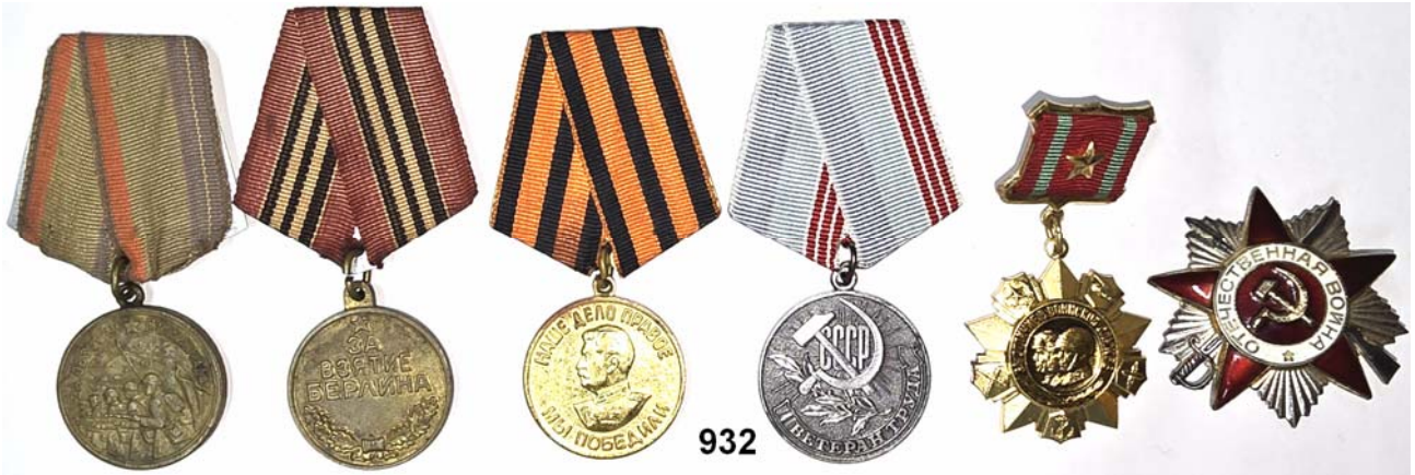
932 Sowjetunion, Sechs Orden und diverse Kleinabzeichen der Sowjetarmee. LOT 38 Stück. Meist ordentliche Erhaltung 40,-