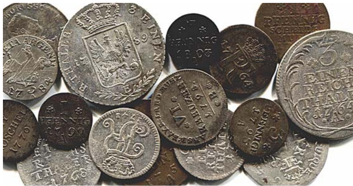
400 LOTS LOTS LOTS